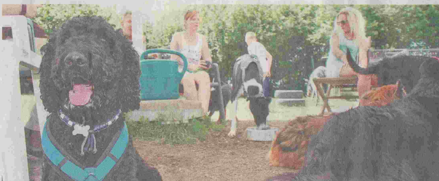
Im Schatten erstmal ein bisschen aushecheln, bevor es weitergeht.