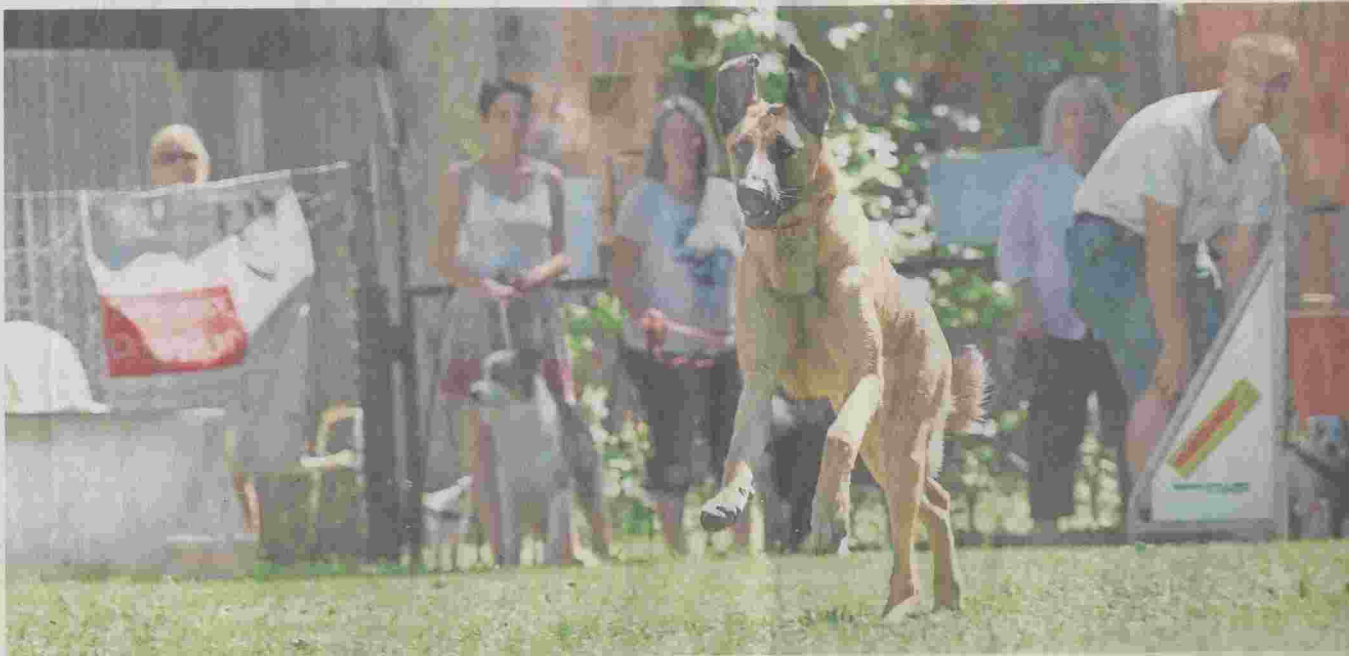
Mit fliegenden Ohren jagen die Vierbeiner am Tag des Hundes über den Parcours in Stadtsteinach.