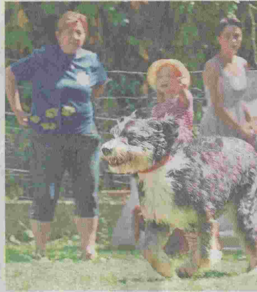
Rumtoben mit Herrchen und Frauchen macht Spaß.