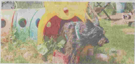
Nach dem Tunnel in Neuenmarkt wartet das nächste Leckerli.

Stadtsteinach/Neuenmarkt – Die Tierfreunde Stadtsteinach und der Verein „Hundepower auf vier Pfoten – dem Erlebniszentrum für Mensch und Hund in Neuenmarkt“ haben den „Tag des Hundes“ am Sonntag zum Anlass genommen, die Arbeit in ihren Vereinen der breiten Öffentlichkeit vorzustellen. Dabei gab es Hundesportvorführungen und umfangreiche Informationen über Haltung, Bedürfnisse und Erziehung der Vierbeiner.