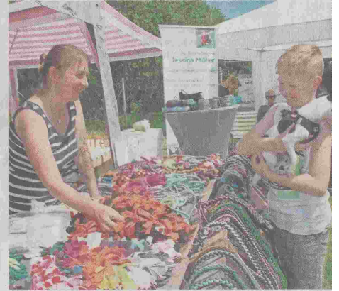
Accessoires für den Hund aus dem Neuenmarkter Pfötchenstüberl.