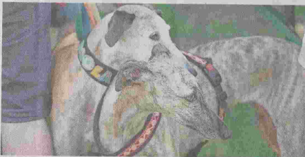
Immer ein Blickfang: Galgos.